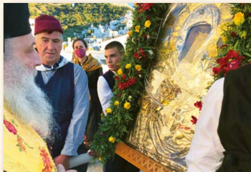
Ἡ Παναγία ἡ Βουρλιώτισσα στό Φιλῶτι τῆς Νάξου (15-7-2022).