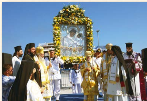
Πανήγυρις Παναγίας Έκατονταπυλιανής Πάρου (15-8-2022).