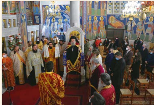
Πανήγυρις Αγίου Νικολάου Πλανᾶ (Νάξος 2-3-2022).