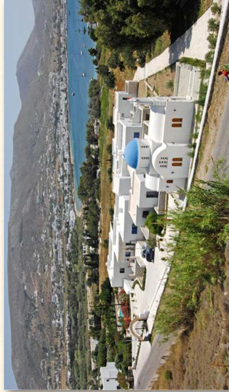
Έκκλησιαστικόν Γηροκομείον «Παναγία ή Έκατονταπυλιανή» έν Πάρω.