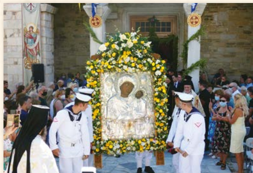
Πανήγυρις Παναγίας Έκατονταπυλιανής Πάρου (15-8-2022).