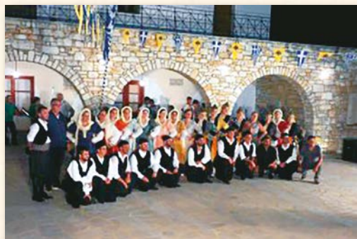
Έκδήλωση μνήμης για την Μικρασιατική Καταστροφή στο Άσπρο Χωριό Πάρου (12-9-2022).