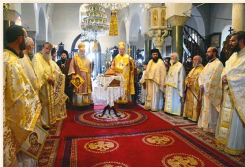
Πανήγυρις Παναγίας Χρυσοπολιτίσσης ἐν Νάξῳ (21-11-2022).