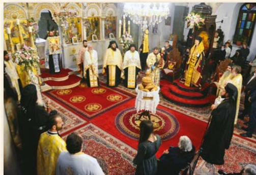
Πανήγυρις Παναγίας Χρυσοπολιτίσσης ἐν Νάξῳ (21-11-2022).