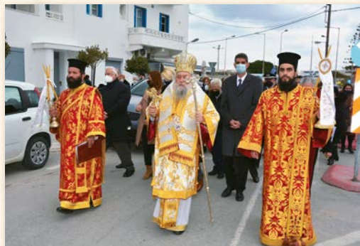
Πανήγυρις Αγίου Νικολάου Πλανᾶ (Νάξος 2-3-2022).