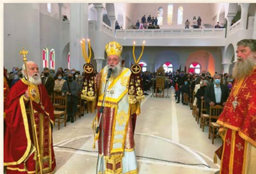
Πανήγυρις Παναγίας Αργοκοιλιώτισσης ἐν Νάξῳ (29-4-2022).