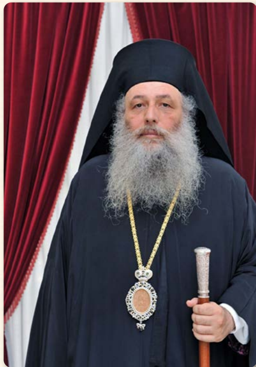
Ὁ Σεβασμιώτατος Μητροπολίτης Παροναξίας κ. ΚΑΛΛΙΝΙΚΟΣ