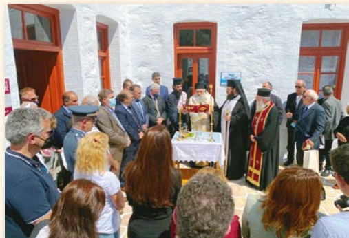
Ἐγκαίνια Πνευματικῆς Κέντρου Φιλωτίου (15-5-2022).