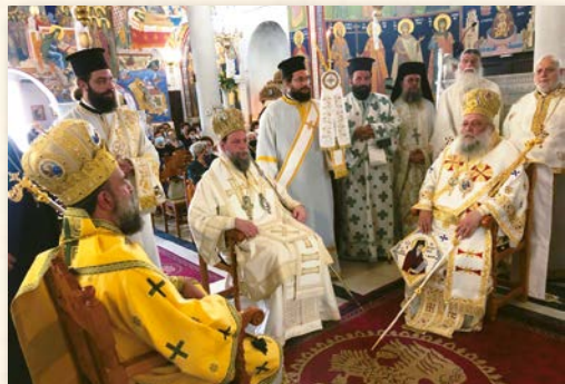
Πανήγυρις Αγίου Νικοδήμου εν Νάξω (14-7-2022).