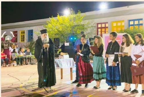
Έκδήλωση με τίτλο «100 χρόνια μνήμης, 1922-2022», ἀφιερωμένη στην Μικρασιατική Καταστροφή στό Δημοτικό Σχολείο Φιλωτίου Νάξου (14-6-2022).