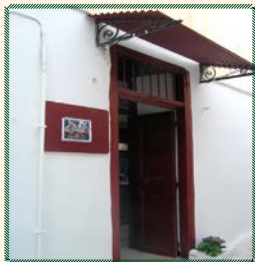
Η Στέγη Αγάπης «Παναγία ή Έλεούσα», Πόλεως Νάξου προσφέρει καθημερινά νόστιμο και ζεστό φαγητό σε όλους τους αδελφούς μας που τό έχουν ανάγκη.

Η Ίερά Μητρόπολις Παροναξίας προσφέρει καθημερινά νόστιμο, μαγειρεμένο, ζεστό φαγητό.