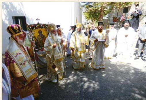
Πανήγυρις Αγίου Άθανασίου του Παρίου (25-6-2022). 300 χρόνια από τή γέννησή του (1722-2022).