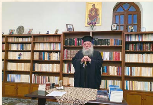
Σύναξη Ιερέων Νάξου (22-9-2022).