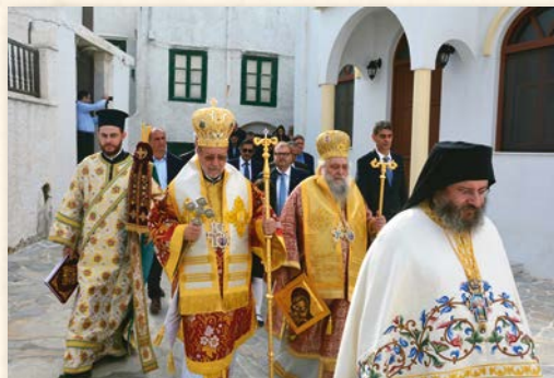
Πανήγυρις Παναγίας Χρυσοπολιτίσης ἐν Νάξῳ (21-11-2022).