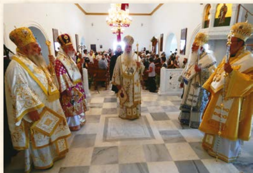
Πανήγυρις Αγίου Άθανασίου του Παρίου (25-6-2022). 300 χρόνια από τή γέννησή του (1722-2022).