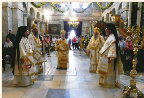
Πανήγυρις Παναγίας Έκατονταυλιανής Πάρου (15-8-2022).