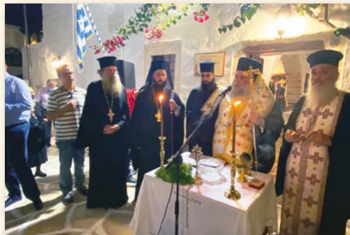
Έγκαίνια Έκκλησιαστικού καί Λαογραφικού Μουσείου Ένορίας Φιλωτίου Νάξου (25-8-2022).