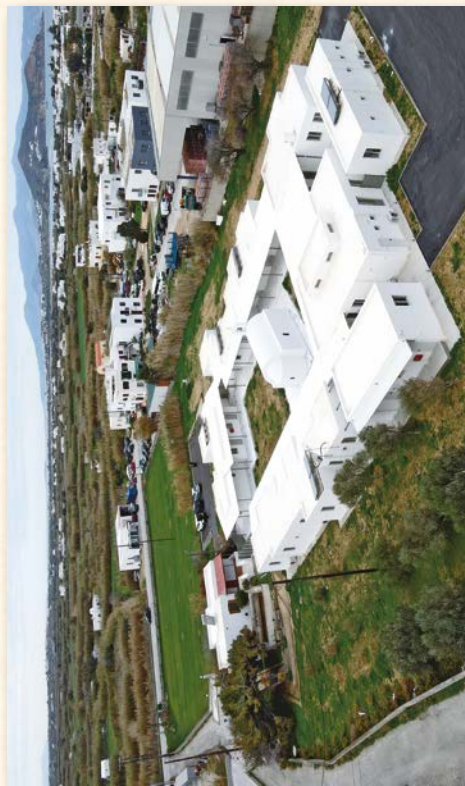
Ἐκκλησιαστικὸν Γηροκομεῖον «Ὁ Ἅγιος Παντελεήμων» ἐν Νάξῳ.