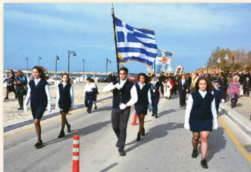
Πανήγυρις Παναγίας Χρυσοπολιτίσσης ἐν Νάξῳ (21-11-2022).