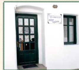
Η Στέγη Αγάπης «Άγ. Θεοκτίστη», Παροικίας Πάρου, προσφέρει καθημερινά νόστιμο και ζεστό φαγητό σε όλους τους αδελφούς μας που τό έχουν ανάγκη.

Η έμπρακτη έκδήλωση της αγάπης μας άποτελεί πλέον ανάγκη έπιτακτική.