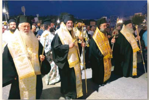
Πανήγυρις Άγιου Νικοδήμου εν Νάξω (14-7-2022).