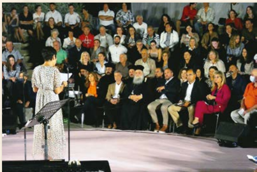
Άπό τήν ἐκδήλωση μνήμης γιά τά 100 χρόνια ἀπό τήν Μικρασιατική Καταστροφή στό ΓΕΛ Πάρου (26-9-2022).