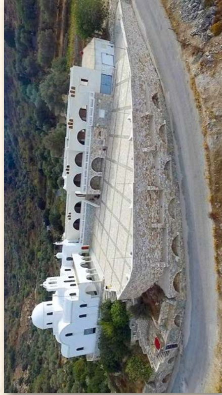
Ένοριακή Στέγη Αγάπης «Αγ. Ειρήνη Χρυσοβαλάντου», Ι. Ν. Κοιμήσεως Θεοτόκου Φιλωτίου Νάξου, (υπό ανέγερση).