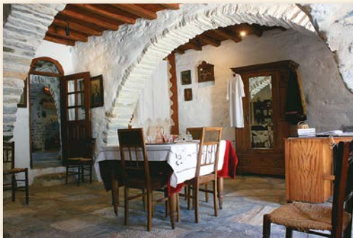
Έγκαίνια Έκκλησιαστικού καί Λαογραφικού Μουσείου Ένορίας Φιλωτίου Νάξου (25-8-2022).