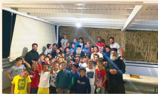
Έπίσκεψη Σεβασμιωτάτου στις Κατασκηνώσεις της Νάξου (3-7-2022).