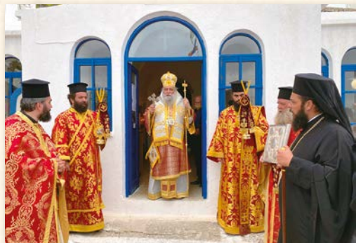
Πανήγυρις Παναγίας Αργοκοιλιώτισσης ἐν Νάξῳ (29-4-2022).