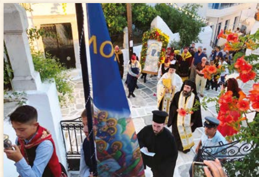
Ἡ Παναγία ἡ Βουρλιώτισσα στό Φιλῶτι τῆς Νάξου (15-7-2022).