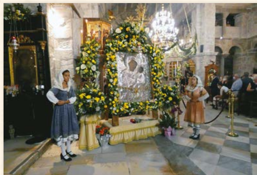
Πανήγυρις Παναγίας Έκατονταυλιανής Πάρου (15-8-2022).