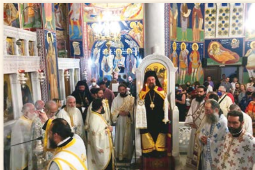
Πανήγυρις Αγίου Νικοδήμου εν Νάξω (14-7-2022).