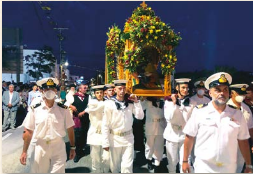
Πανήγυρις Άγιου Νικοδήμου εν Νάξω (14-7-2022).