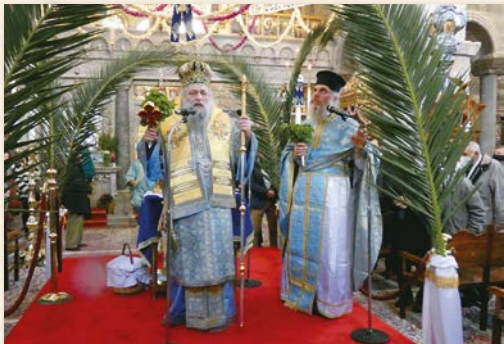
Έορτή Θεοφανείων (Πάρος 6-1-2022).