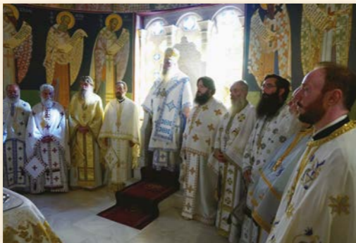
Πανήγυρις Άγιου Νικοδήμου εν Νάξω (14-7-2020).