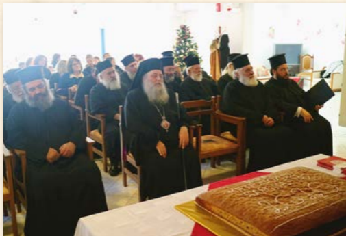
Πρωτοχρονιάτικη σύναξη ιερατικῶν οἰκογενειῶν Πάρου.