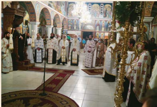
Πανήγυρις Αγίου Άρσενίου ἐν Πάρῳ.