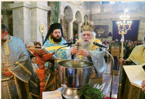
Εορτή Θεοφανείων (Πάρος 2020).