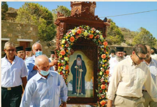
Πανήγυρις Αγίου Άρσενίου έν Πάρω.