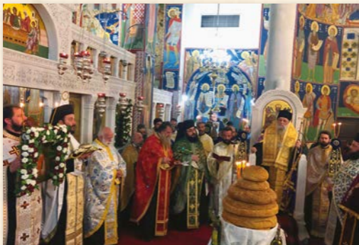
Πανήγυρις Ἁγίου Νικολάου Πλανᾶ (Νάξος 2-3-2020).