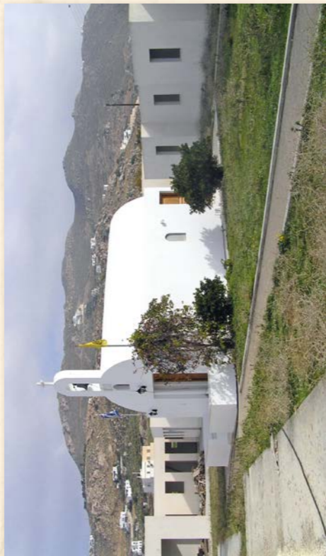
Ἐκκλησιαστικὸν Γηροκομεῖον «Ὁ Ἅγιος Παντελεήμων» ἐν Νάξῳ, (ὑπὸ ἀποπεράτωσιν).