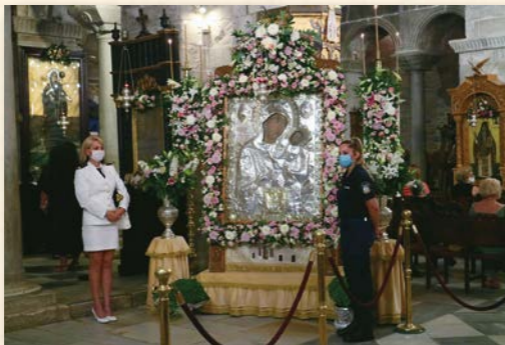
Πανήγυρις Παναγίας Έκατονταπυλιανής Πάρου (15-8-2020).