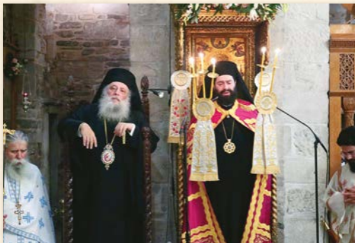
Πανήγυρις Παναγίας Έκατονταπυλιανής Πάρου (15-8-2020).