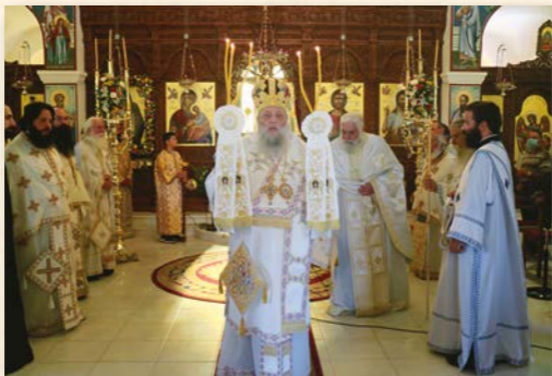
Πανήγυρις Αγίου Άρσενίου έν Πάρω.