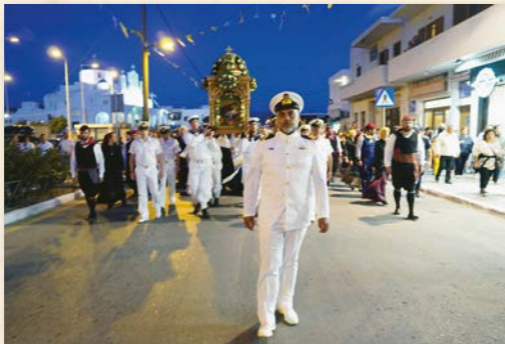
Πανήγυρις Άγιου Νικοδήμου ἐν Νάξῳ (14-7-2020).