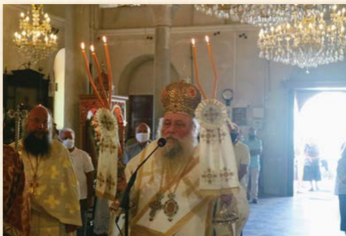
Πανήγυρις Ἁγίου Ἰωσήφ στίς Λεύκες Πάρου (28-08-2020)

Παρά τίς δυσκολίες τῶν μέτρων ὑγειονομικῆς προστασίας, πού μᾶς ὀδήγησαν στήν ἀναβολή πολλῶν ἐκδηλώσεων ἀφιερωμένων στόν μεγάλο αὐτό Γέροντα, μέ θρησκευτική κατάνυξη καί μέ τήν συμμετοχή κλήρου καί λαοῦ τῆς νήσου Πάρου τελέσθηκε στίς 27 καί 28 Αὐγούστου ὁ Ἑσπερινός καί ἡ πρώτη Πανηγυρική Θεία Λειτουργία προεξάρχοντος τοῦ Σεβασμιωτάτου Ποιμενάρχου μας ἐπί τῇ Μνήμῃ τοῦ Ὁσίου Πατρός ἡμῶν Ἰωσήφ τοῦ Σπηλαιώτου τοῦ Παρίου, στή γενέτειρά του νήσο Πάρο καί συγκεκριμένα στό κεφαλοχώρι τῶν Λευκῶν.