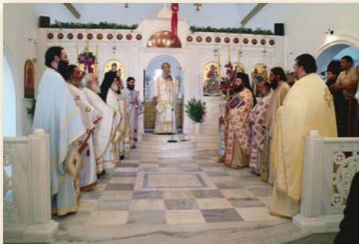
Πανήγυρις Αγίου Ἀθανασίου τοῦ Παρίου (25-6-2020).