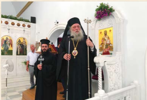
Πανήγυρις Αγίου Ἀθανασίου τοῦ Παρίου (25-6-2020).