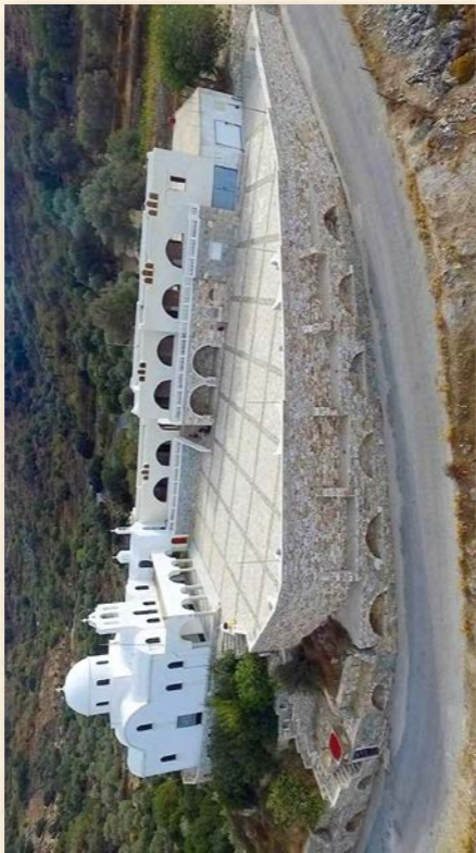
Ενοριακή Στέγη Αγάπης «Αγ. Ειρήνη Χρυσοβαλάντου», Γ. Ν. Κοιμήσεως Θεοτόκου Φιλωτίου Νάξου, (υπό ανέγερσιν).