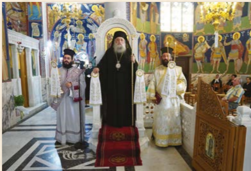
Πανήγυρις Αγίου Νικοδήμου ἐν Νάξῳ (14-7-2020).