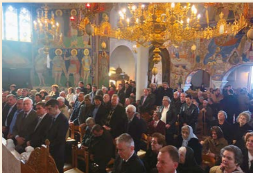
Πανήγυρις Άγιου Νικολάου Πλανᾶ (Νάξος 2-3-2020).