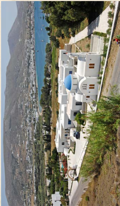
Ἐκκλησιαστικόν Γηροκομεῖον «Παναγία ἢ Ἑκατονταπυλιανή» ἐν Πάρῳ.