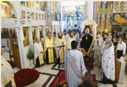
Πανήγυρις Αγίου Νικοδήμου ἐν Νάξῳ (14-7-2020).