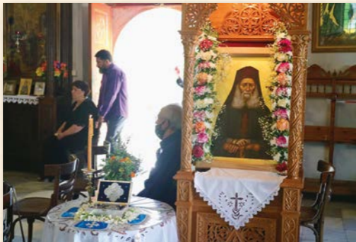
Πανήγυρις Ἁγίου Ἰωσήφ στίς Λεύκες Πάρου (28-08-2020)