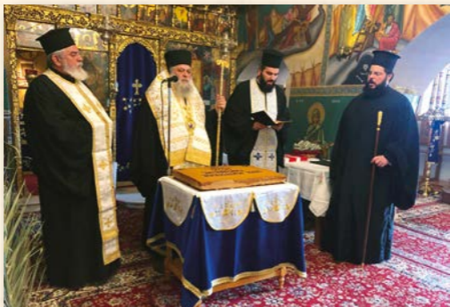
Χριστουγεννιάτικη Σύναξη ιερατικῶν οἰκογενειῶν Νάξου.