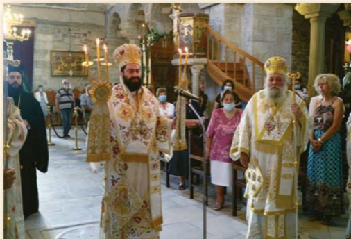
Πανήγυρις Παναγίας Έκατονταπυλιανής Πάρου (15-8-2020).