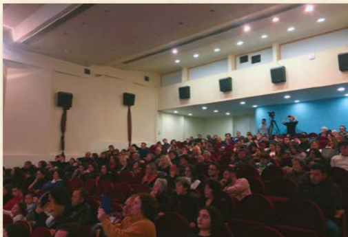
Βράβευση φοιτητῶν Νάξου ἀπὸ τὴν Ἱερά Μητρόπολη.