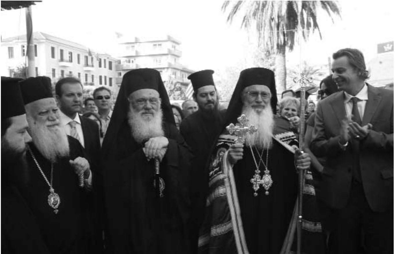
Οί τοπικές Άρχες και ό λαός τής Λειβαδιάς ύποδέχθηκαν πανηγυρικώς τόν Μακαριώτατο Άρχιεπίσκοπο Άθηνών και πάσης Έλλάδος κ. Ίερώνυμο και τόν νέο Σεβ. Μητροπολίτη Θηβών και Λεβαδείας κ. Γεώργιο.

Δέν πρέπει όμως νά λησμονοῦμε μία μεγάλη ἀλήθεια. Ἡ Ἐκκλησία, μέ τὸ ἀλάθητο ἀγιοπνευματικό της αἰσθητήριο, ἀναγνώριζε και ἀναγνωρίζει πάντοτε ὡς τὸν κατ' ἔξοχὴν «Θρόνο τῆς Δόξης» τοῦ Κυρίου ἡμῶν Ἰησοῦ Χριστοῦ, ὄχι κάποιο λαμπρὸ και χρυσοποίκιλο βασιλικὸ θῶκο, ἀλλὰ τὸν αἵματοβαφῆ Σταυρὸ και τὰ σύμβολα τοῦ πάθους πὸν τὸν περιστοιχίζουν. Αὐτὸ σημαίνει ὅτι ἀποστολὴ τοῦ Χριστοῦ στὸν κόσμο, και ἐπομένως και τοῦ Ἐπισκόπου, ὡς κατὰ χάριν ὑπέχοντος τὴν θέσιν τοῦ Χριστοῦ, δέν εἶναι κυριαρχία και ἐπιβολὴ ἀπὸ θέσεως ἰσχύος και ὑπεροχῆς, ἀλλὰ μέχρι αἵματος θυσιαστικὴ ἀγάπη και διακονία τοῦ πάσχοντος ἀνθρώπου, καθὼς ὁ Χριστὸς «οὐκ ἦλθε διακονηθῆναι, ἀλλὰ διακονῆσαι».