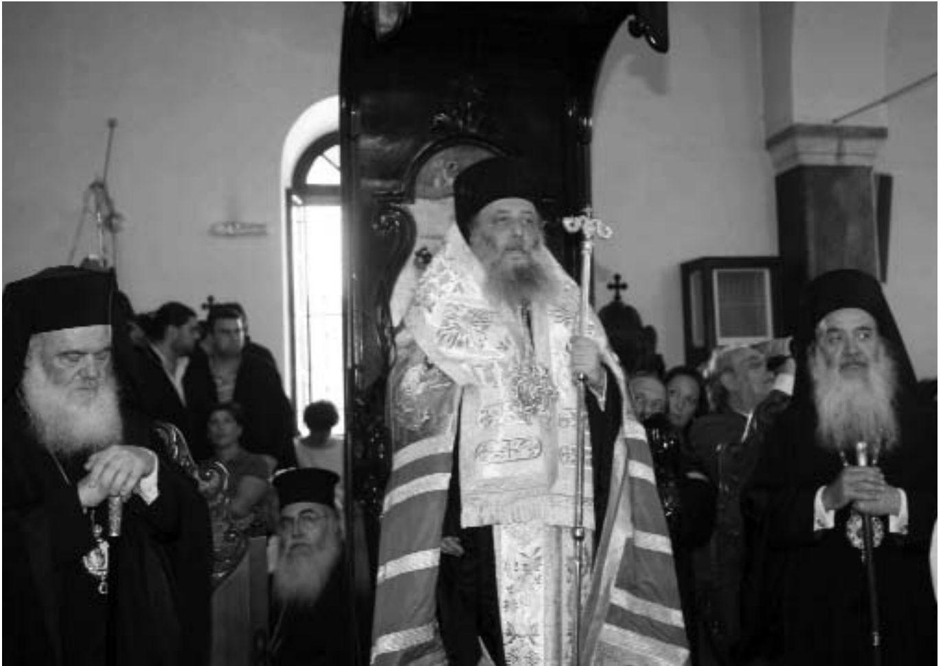
Ὁ Σεβ. Μητροπολίτης Παροναξίας κ. Καλλίνικος κατά τὴν τελετὴ ἐνθρονίσεως στὴ Νάξο, περιστοιχιζόμενος ἀπὸ τὸν Μακαριώτατο Ἀρχιεπίσκοπο Ἀθηνῶν καὶ πάσης Ἑλλάδος κ. Ἱερώνυμο καὶ τὸν Τοποτηρητὴ Σεβ. Μητροπολίτη Σάμου κ. Εὐσέβιο.

τὸν τομέα τοῦ νεανικοῦ ἔργου. Βέβαια οἱ νέοι καὶ οἱ νέες μας ἐδῶ στὰ νησιά μας, λόγω τῆς τρομερῆς τουριστικῆς λαίλαπας κατὰ τὴν διάρκεια τοῦ καλοκαιριοῦ, ἀντιμετωπίζουν πολλοὺς πειρασμοὺς πού θέτουν σὲ κίνδυνο τόσο τὴν πνευματικὴ ὅσο καὶ τὴν σωματικὴ τους ἀκεραιότητα καὶ ὑγεία. Γι' αὐτὸ χρειάζεται ἡ συστράτευση ὅλων μας, γονέων, ἐκπαιδευτικῶν καὶ Ἑκκλησίας, ὥστε νὰ ὀπλίζονται μὲ πνευματικὰ ἐφόδια ἱκανὰ νὰ τοὺς βοηθήσουν στὶς δύσκολες στιγμὲς τῆς ζωῆς. Θέλω πάντως νὰ γνωρίζουν, ὅπως καὶ ὅλοι οἱ κάτοικοι τῶν νησιῶν μας, ὅτι δόξα τῷ Θεῷ, ἡ Μητρόπολή μας εἶναι μικρὴ καὶ ἀνθρώπινη καὶ ἄρα οἱ σχέσεις μας προσωπικὲς καὶ οἰκογενειακὲς, ὡς ἐκ τούτου θὰ πρέπει νὰ νιώθουν ὅλη τους τὴν ἄνεση νὰ χτυποῦν τὴν πόρτα τοῦ Ἐπισκοπείου γιὰ νὰ συζητοῦν μὲ τὸν Ἐπίσκοπο καὶ