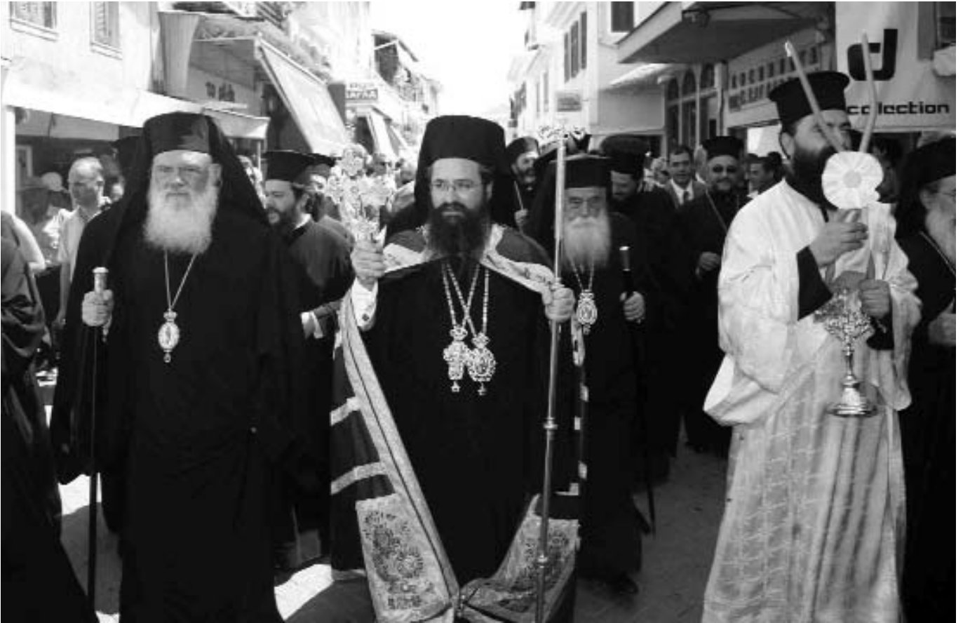
Ἡ Λευκάδα ὑποδέχθηκε με συγκίνηση τὸν Μακαριώτατο Ἀρχιεπίσκοπο Ἀθηνῶν καὶ πάσης Ἑλλάδος κ. Ἱερώνυμο καὶ τὸν νέο Σεβ. Μητροπολίτη Λευκάδος καὶ Ἰθάκης κ. Θεόφιλο.

δίση στὸ νὰ δοξάσω καὶ ἀνυμνήσω πλουσίως τὸ ὑπερύμνητο καὶ ὑπερδεδοξαμένο Ὄνομα τοῦ Πατρὸς καὶ τοῦ Υἱοῦ καὶ τοῦ Ἁγίου Πνεύματος γιὰ τὴν μεγάλη δωρεά, νὰ με ἀναδείξῃ Ποιμένα ψυχῶν μέσα στὴν Ἐκκλησία τοῦ Χριστοῦ, διάδοχο τῶν μεγάλων καὶ Ἁγίων Ἀποστόλων καὶ Πατέρων, οἱ ὁποῖοι ἐδόξασαν τὸ ὄνομά Του καὶ ἐτίμησαν τὴν ἀτίμητη μητέρα μας, τὴν Ἐκκλησία. Ὅπως, ἐπίσης, κανεὶς δὲν μπορεῖ νὰ με ἐμποδίση νὰ ἀπευθύνω πολλές καὶ θερμὲς εὐχαριστίες πρὸς τὴν Σεπτὴ Ἱεραρχία τῆς Ἐκκλησίας τῆς Ἑλλάδος καὶ ἰδιαίτερος πρὸς τὸν Σεπτὸ Προκαθήμενο Αὐτῆς, Μακαριώτατο Ἀρχιεπίσκοπο Ἀθηνῶν καὶ πάσης Ἑλλάδος Κύριο Ἱερώνυμο γιὰ τὴν μεγάλη τιμὴ τῆς Ἀρχιερατικῆς Χάριτος, τὴν ὁποία διὰ τοῦ Παναγίου καὶ τελεταρχικοῦ Πνεύματος δέχθηκα.