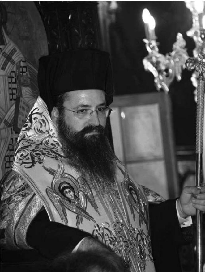
Ὁ Σεβ. Μητροπολίτης Λευκάδος καὶ Ἰθάκης κ. Θεόφιλος.

εὐχαὶ καὶ εὐχόμει «ἐκ βαθέων» νὰ ἀναπαύῃ αὐτοὺς ὁ Κύριος «ἐν Χώρα ζώντων καὶ ἐν σκηναῖς δικαίων».