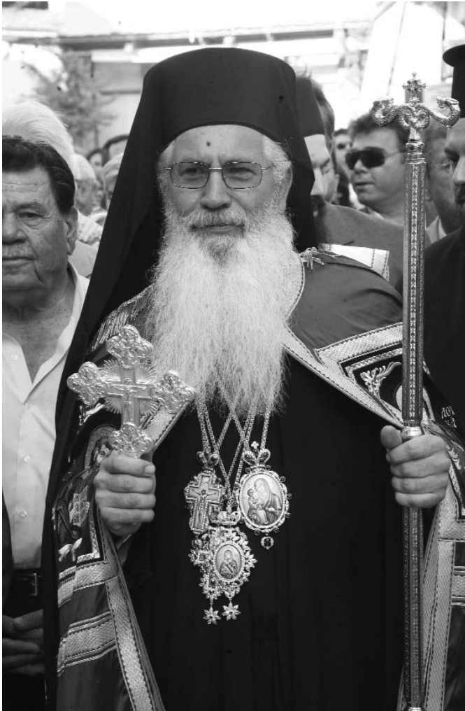
Ὁ Σεβ. Μητροπολίτης Θεβῶν καὶ Λεβαδείας κ. Γεώργιος

στοὺς ὁποίους γίνεται δυνατὴ ἡ πραγματοποίησι τοῦ ἐκκλησιαστικοῦ προνοιακοῦ μας ἔργου.